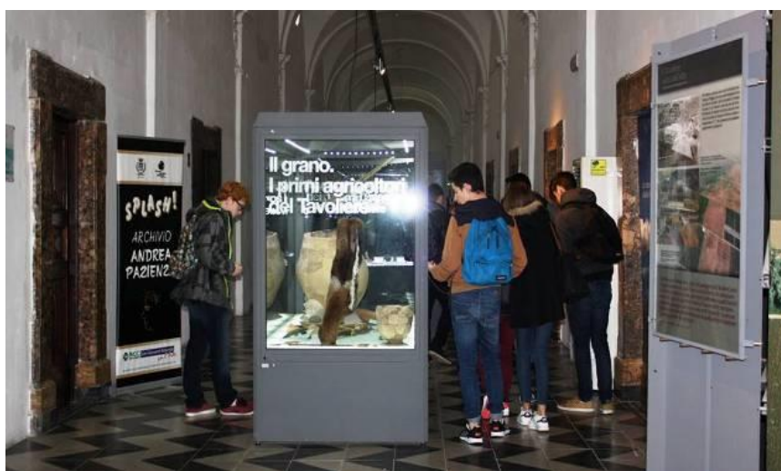
La collezione archeologica del MAT Museo dell'Alto Tavoliere

Visite guidate gratuite alla collezione archeologica, alla Pinacoteca " Luigi Schingo " e a " Splash! Archivio Andrea Paziienza ", centro di documentazione dedicato al celebre fumettista Andrea Paziienza. Le visite sono svolte dagli operatori del Servizio Civile Nazionale e sono indirizzate ad ogni tipo di pubblico: da singoli visitatori a gruppi organizzati, o tipologie di utenti di vario genere.