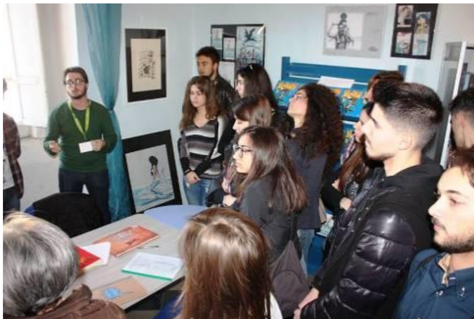
"SPLASH! Archivio Andrea Pazienza", MAT Museo dell'Alto Tavoliere di San Severo

Presso il MAT Museo dell'Alto Tavoliere-Città di San Severo è stato istituito nell'aprile del 2015 un archivio dedicato ad Andrea Pazienza in cui sono consultabili tutte le opere del grande artista sanseverese, la rassegna stampa completa, i video realizzati con Pazienza come protagonista, le locandine dei film da lui disegnate, le sceneggiature da lui curate, le illustrazioni dei dischi, in modo da essere punto di riferimento, per l'Italia centro-meridionale, di tutti gli studi e le tesi che si compiono su Andrea Pazienza. Lo SPLASH! – Centro "Andrea Pazienza" è parte integrante del MAT – Museo dell'Alto Tavoliere ed è accessibile al pubblico nei medesimi orari di apertura del museo.