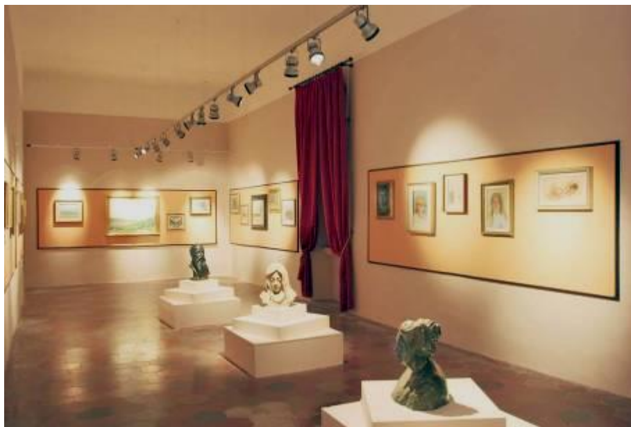
La Pinacoteca "Luigi Schingo", MAT Museo dell'Alto Tavoliere