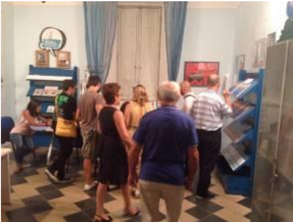
"SPLASH! Archivio Andrea Paziienza", MAT Museo dell'Alto Tavoliere